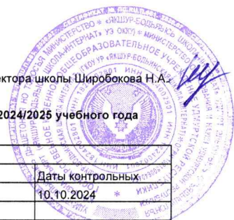
График проведения оценочных процедур в 1-4 классах ГКОУ УР "Якшур-Бодьинская школа-интернат" на 1 четверть 2024/2025 учебного года